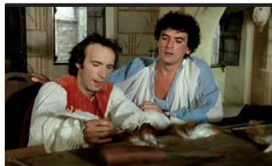
Film Still: Non ci resta che piangere Regia: Massimo Troisi, Roberto Benigni

Partiti in automobile da Frittolo (FI), Saverio, maestro elementare, e Mario, bidello, si ritrovano, per uno strano scherzo del caso, nel 1492. Decidono di recarsi a Palos, in Andalusia, per fermare Cristoforo Colombo e impedirgli di scoprire le Americhe. Incontrano Leonardo da Vinci che inventa il treno. Divertente, anemico, mette a frutto tutta la simpatia e l'estro dei due protagonisti, autori con Giuseppe Bertolucci, attori, registi. In termini circensi, Benigni rappresenta il clown, Troisi l'Augusto.